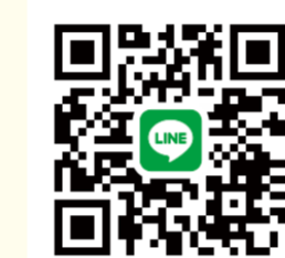
↑横浜ポルタ公式SNSはこちら!

散策やショッピングをお楽しみの場合に、バラエティに富んだカフェやレストランで一息ついてはいかがでしょうか?