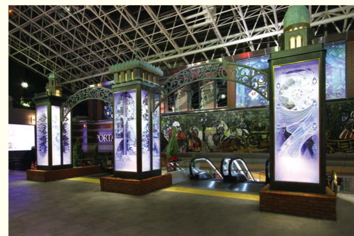
↑メインモニュメントのPORTA横浜三塔物語

イタリア語で、「門」の意味を持つPORTAは横浜駅直結でアクセス抜群のショッピングセンター。メインエントランスにはその名にちなんで建てられた「PORTA横浜三塔物語」がお出迎え。横浜三塔物語をくぐれば、ファッション・グルメ・サービスの専門店が立ち並びます。