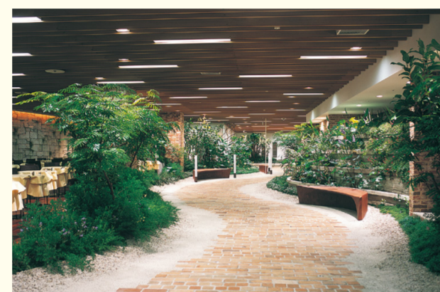
↑10階=ダイニングパーク横浜

1985年開店。ファッション、インテリア、フード、専門店から構成され、品ぞろえを充実、お客さまのライフスタイル提案に向けたショッピング空間を提供しています。コンシェルジュが店内案内からお買い物のご相談まで承ります。横浜駅からのアクセスが良く、地下1階に免税カウンターがあります。