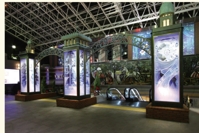
↑メインモニュメントのPORTA横浜三塔物語

散策やショッピングをお楽しみの場合に、バラエティに富んだカフェやレストランで一息ついてはいかがでしょうか?