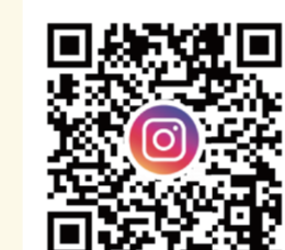
↑横浜ポルタ公式SNSはこちら!